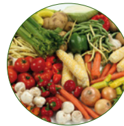
8 - 10 Portionen Gemüse