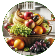
8 - 10 Portionen Obst

... so klein, und doch enthält es das antioxidative Äquivalent von 8 - 10 Portionen Obst, 8 - 10 Portionen Gemüse und 2 -3 Portionen gesunder Omega Fettsäuren.