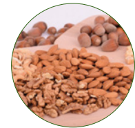
2 -3 Portionen gesunder Omega Fettsäuren.

Tatsächlich enthält der Samen 30 mal mehr Nährstoffe und antioxidatives Potential als die ihr umgebende Frucht