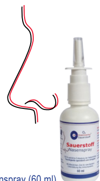
O 4 Sauerstoff Nasenspray (60 ml)

Anwendung: Gut schütteln. Den Kopf aufrecht halten, die Düse leicht in die Nasenöffnung einführen und nach Bedarf 1-3 Mal sprühen. Bei Bedarf wiederholen.