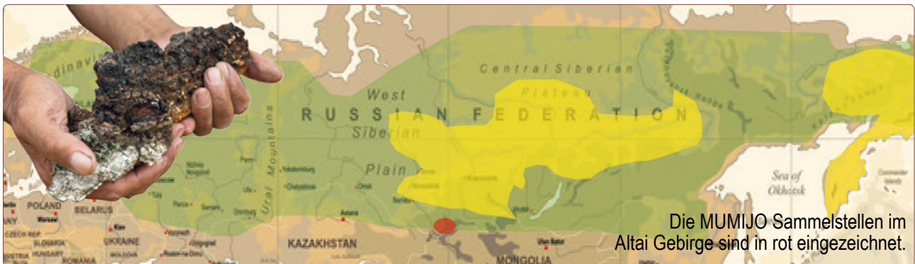
Die MUMIJO Sammelstellen im Altai Gebirge sind in rot eingezeichnet.